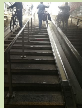
Tapis roulant voor de fiets.