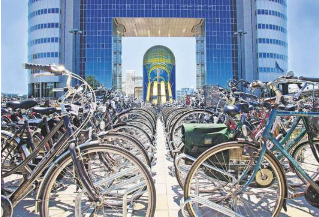
Een fietsenstalling bij de Mandelabrug in Zoetermeer.

Nu nog is de stationsuitgang aan de Boerhaavelaan een stille uithoek in het verlopen Entreegebied. Met de bouw van de nieuwbouwwijk Entree, 4500 tot mogelijk 5700 woningen op de plek waar nu lege, oude kantoren staan, ligt het station dus straks naast een levendige buurt.